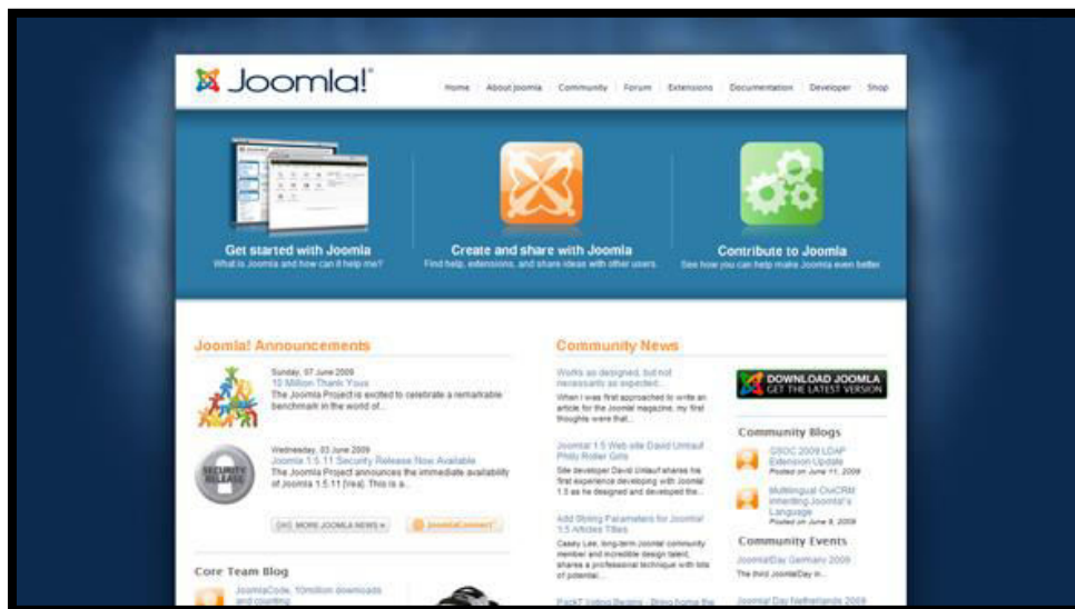
Rajah 4.2 : Contoh Antaramuka Joomla

Joomla merupakan platform yang telah memenangi award bagi CMS. Sangat mudah digunakan seperti WordPress dan mempunyai aplikasi yang begitu mantap untuk membangunkan laman web yang lebih menarik. Jika anda sudah biasa menggunakan WordPress anda akan tahu menggunakan Joomla. (Rajah 4.2)